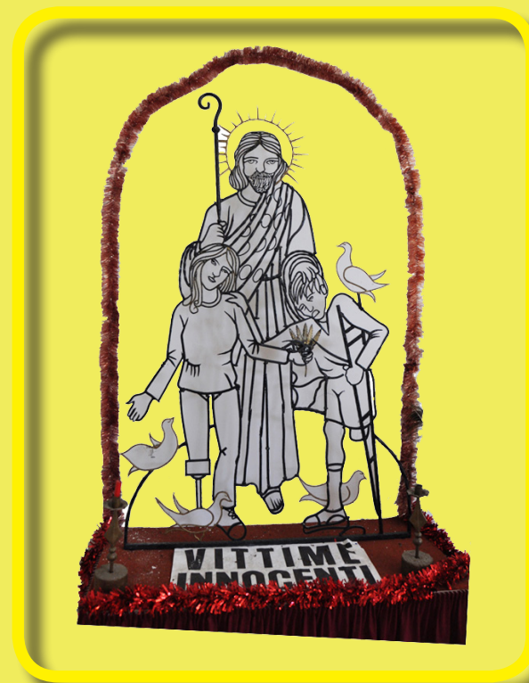
Vittime innocenti ( cm 200 x cm 120 )

Visitatore o ammiratore fermati a contemplare, e sentirai l'anelito di una preghiera, perché il ferro qui parla di autotrascendenza.